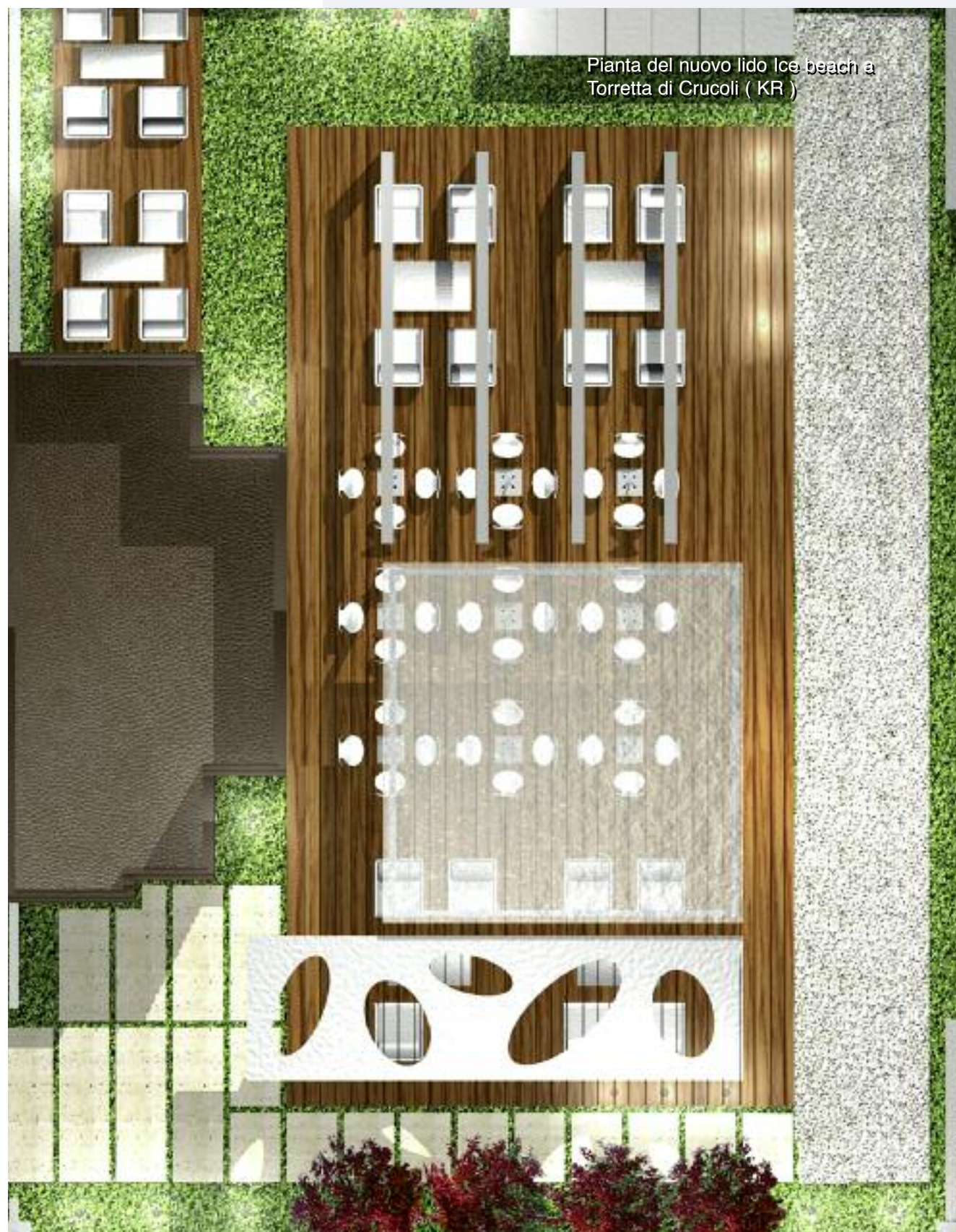
Pianta del nuovo lido Ice beach a Torretta di Cruoli ( KR )

Sammarro nel 2009. Il committente ha richiesto che il progetto dell'albergo a cinque stelle fosse basato sugli stessi concetti del Movida Beach Club, cioè luxury,