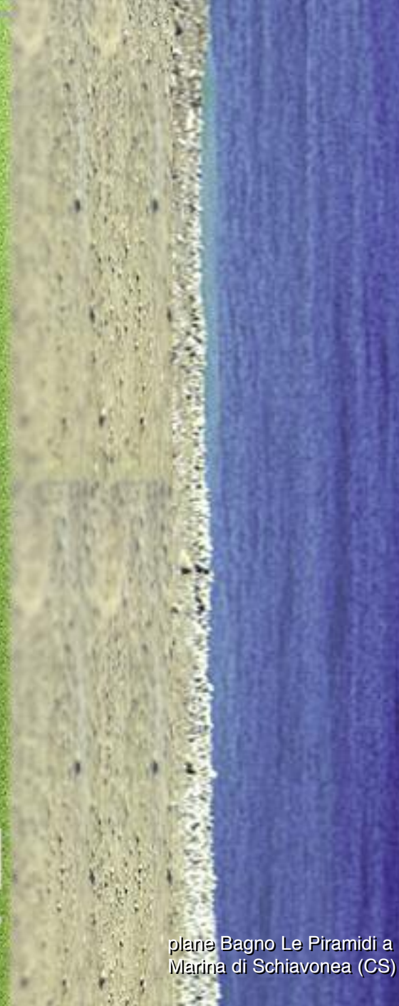
plante Bagno Le Piramidi a Marina di Schiavonea (CS)

S ono tre i progetti di ospitalità dello studio Blu Design Associati Luca Nardi e Pierluigi Sammarro , dedicati ad uno dei settori prevalenti nella Regione Calabria, quale quello turistico e vacanziero. Le locations di questi tre progetti sono situate su una delle coste calabresi più affascinanti, a livello turistico, ed i committenti hanno voluto che il progetto architettonico fosse in simbiosi con la bellezza dei luoghi. Lo studio Blu Design si occupa prevalentemente di ospitalità ma anche di show rooms, locali di intrattenimento, ristoranti e benessere, facendo in modo che all'in-