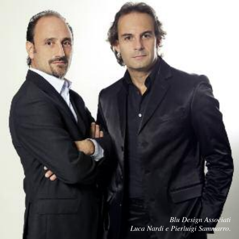
Blu Design Associati Luca Nardi e Pierluigi Sammarro.

R ealizzata in Calabria, tra due importanti comuni limitrofi, Corigliano Calabro e Rossano, la residenza è di circa 350 mq con una superficie esterna di 2000 mq, progettata a mo' di parco con piscina. La location è una delle più belle nel comprensorio della Costa Jonica, dove lo studio Blu Design Associati Luca Nardi e Pierluigi Sammarro ha voluto creare un'opera architettonica e funzionale che desse al fruitore un'emozione ed una sensazione di piacere estetico. L'architettura diventa arte visiva: questo è stato lo scopo che si è voluto realizzare. Fondamentale e rigorosa è l'illuminazione che rende di sera i locali vellutati e neutri, con un ordine ed una nitidezza unici. Prospettive di luce e volumi scolpiti nel bianco assoluto, il colore dominante scel-