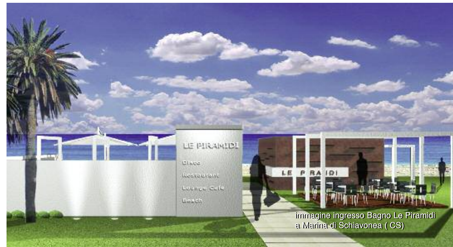
immagine ingresso Bagno Le Piramidi a Marina di Schiavonea (CS)

La struttura verrà realizzata dove già esiste uno dei locali più belli della regione, il Movida Beach Club progettato da Pierluigi