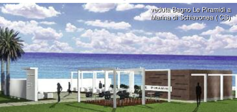
veduta Bagno Le Piramidi a Marina di Schiavonea (CS)