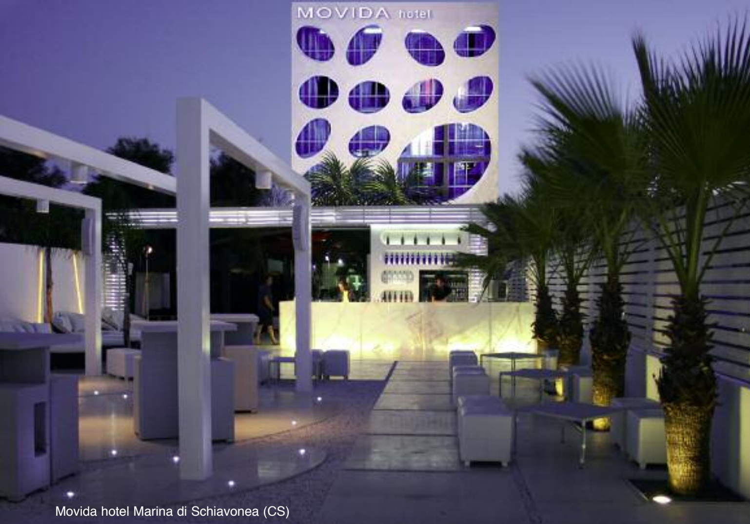
Movida hotel Marina di Schiavonea (CS)

tazione e nel design di interni. Oggi progetta e realizza opere in tutta Italia nonché all'Estero, dove molti dei suoi lavori sono pubblicati sui magazine e libri di architettura più autorevoli.