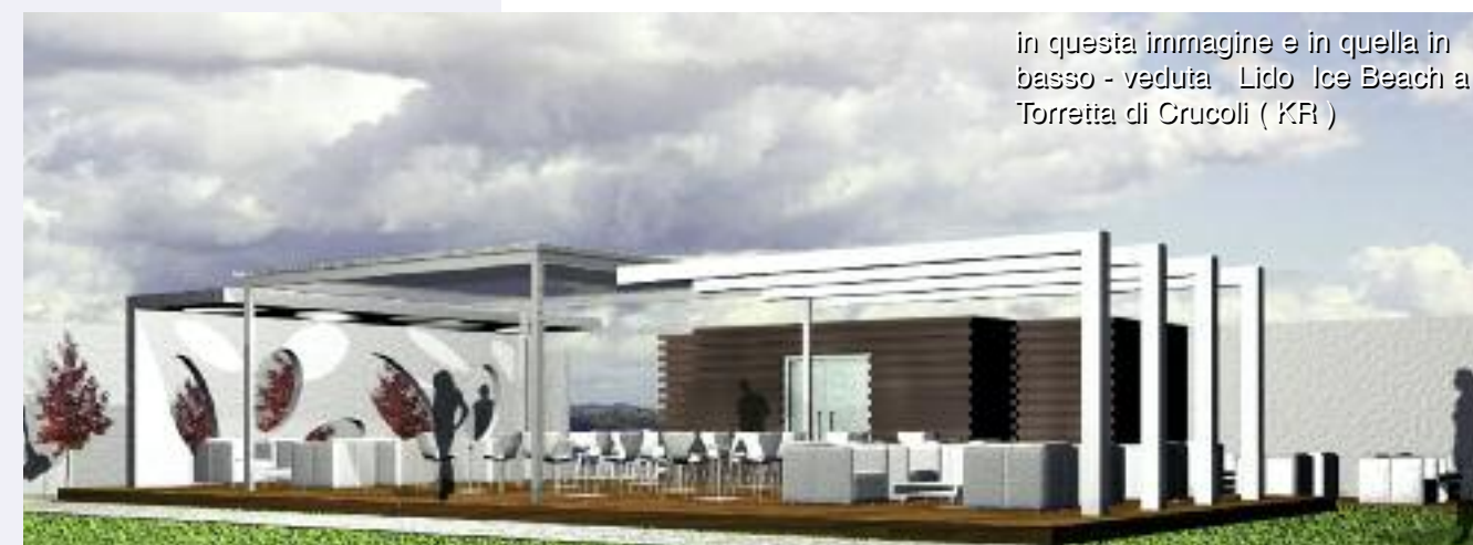
in questa immagine e in quella in basso - veduta Lido Ice Beach a Torretta di Cruoli ( KR )

indirizzato ad un concetto di alto design come molti alberghi situati nelle grandi città, ad esempio gli alberghi del gruppo Boscolo o del gruppo NH Hotel, tecnica-